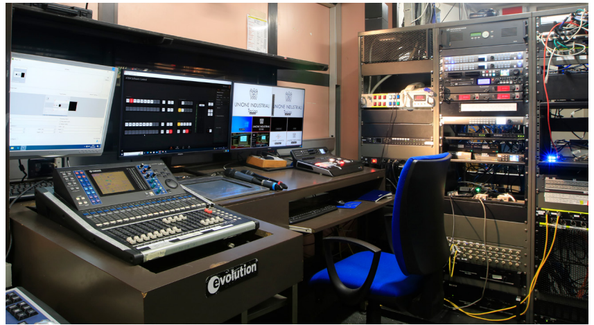
Due scorci della regia di Sala Agnelli, dove possono lavorare in simultanea 2 o più operatori.