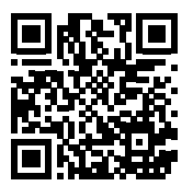
Nel QR Code Sito Barco, videoproiettori serie F80-4K12

Grazie alla divisione Service, anche a lavori in corso, BPC ha comunque messo a disposizione gratuitamente del Centro Congressi (che da Pasqua dello scorso anno aveva riaperto al pubblico) le proprie attrezzature, per permettere alla struttura di continua-