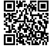
Nel QR Code. Sito Barco, videoproiettori serie F80-4K9