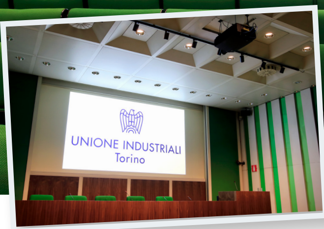
La Sala Piemonte, uno spazio da oltre 170 posti a sedere che è stato recentemente oggetto di restyling tecnico con l'installazione del Barco F80-4K9, visibile sul controsoffitto a poca distanza dallo schermo.

• Centro Congressi. Ci hanno coinvolti in quanto eravamo i referenti principali delle attività di regia fino a quel momento e conoscevamo perfettamente le esigenze del centro e del management ».